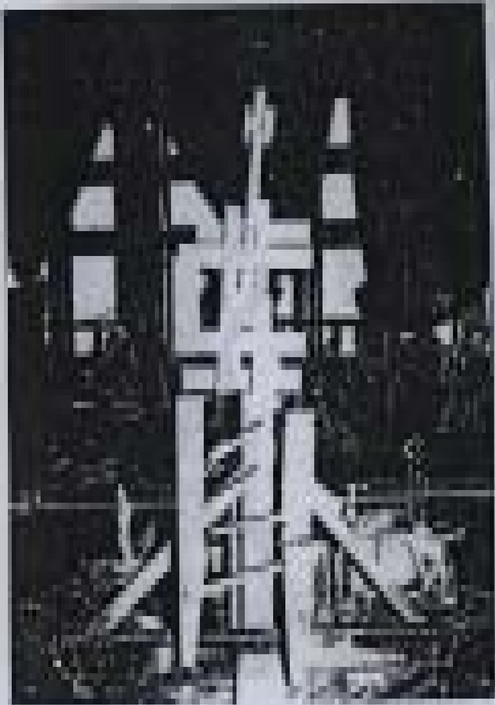
Figure 1: A traditional Burmese wooden structure, possibly a stupa or a decorative post, with intricate carvings and a tiered top.