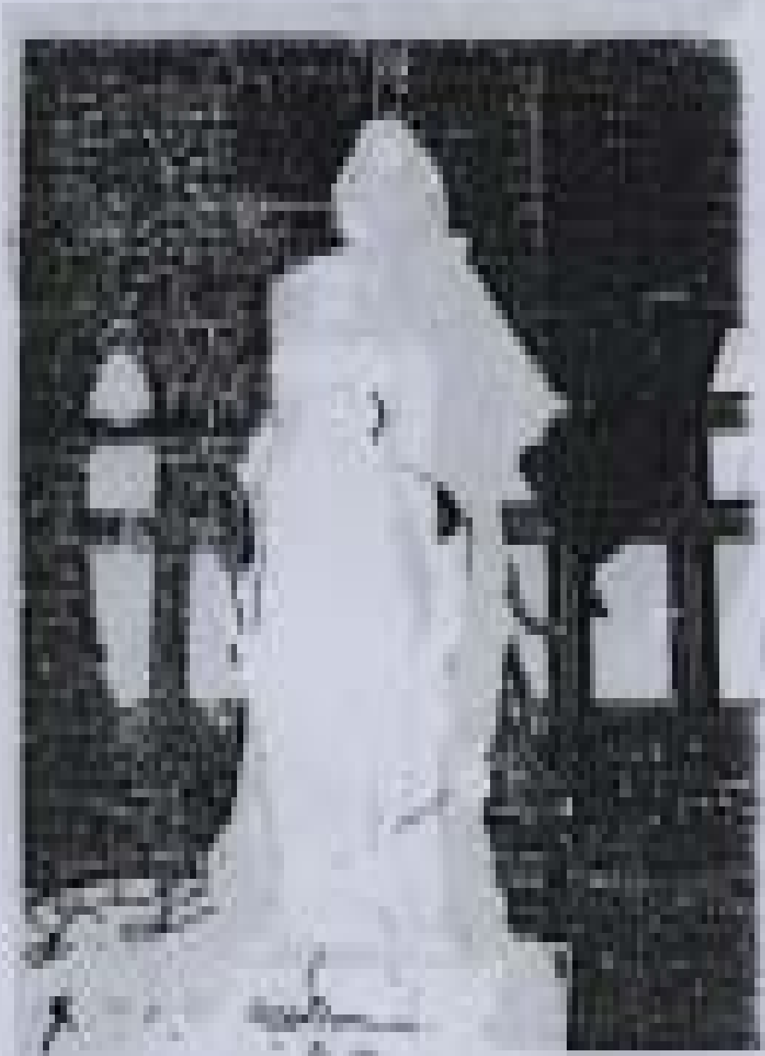
ပန်းပုရုပ် ထုလုပ်ခြင်းဆိုင်ရာ စာတမ်း ခွဲယူစာတမ်း