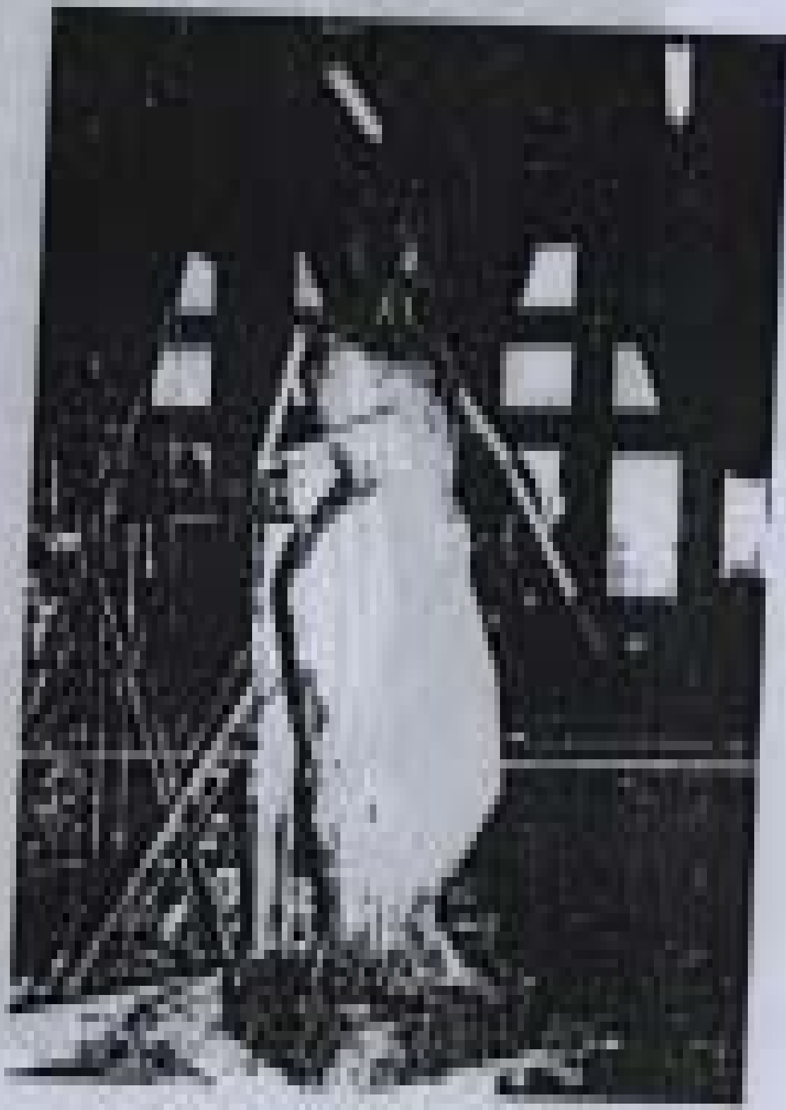
ပန်းပုရုပ် ထုလုပ်ခြင်းဆိုင်ရာ ခွဲယူစာတမ်း