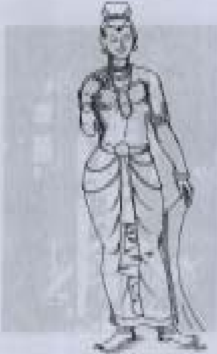
ပန်းပုရုပ် ထုလုပ်ခြင်းဆိုင်ရာ ဓာတုဗေဒ: ဘွဲ့ယူဓာတုဗေဒ