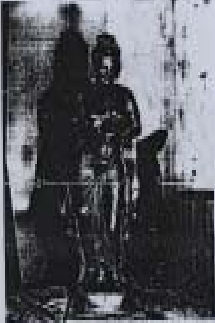
ပန်းပုရုပ် ထုလုပ်ခြင်းဆိုင်ရာ စာတမ်း ခွဲယူစာတမ်း