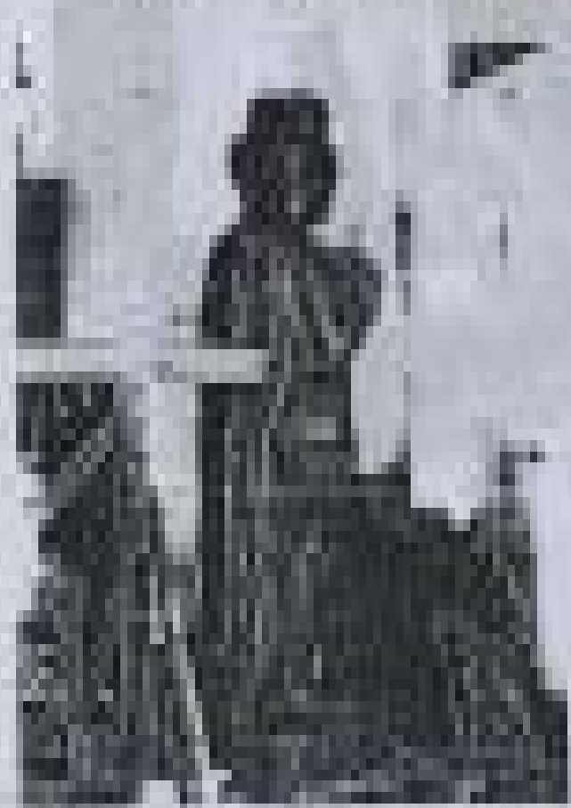
ပန်းပုရုပ် ထုလုပ်ခြင်းဆိုင်ရာ ဓာတုဗေဒ ဘွဲ့ယူစာတမ်း