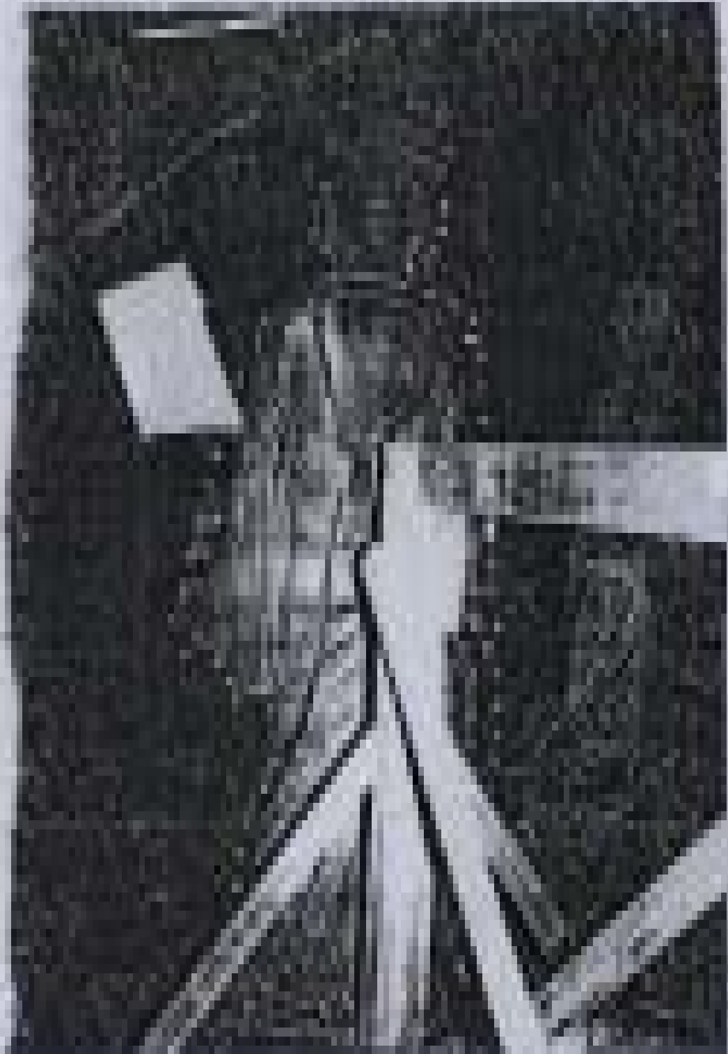
ပန်းပုရုပ် ထုလုပ်ခြင်းဆိုင်ရာ စာတမ်း